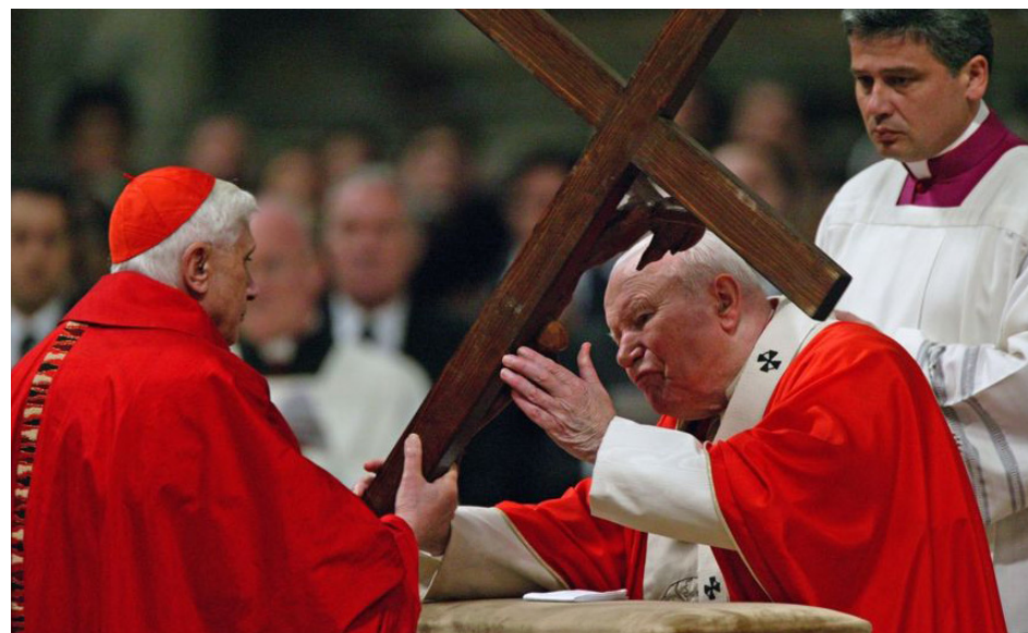
Jan Paweł II w Wielki Piątek przed śmiercią.