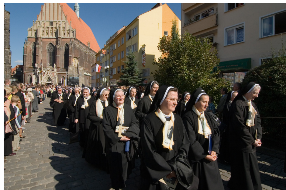
Procesja po uroczystości beatyfikacji Marii Luizy Merkert