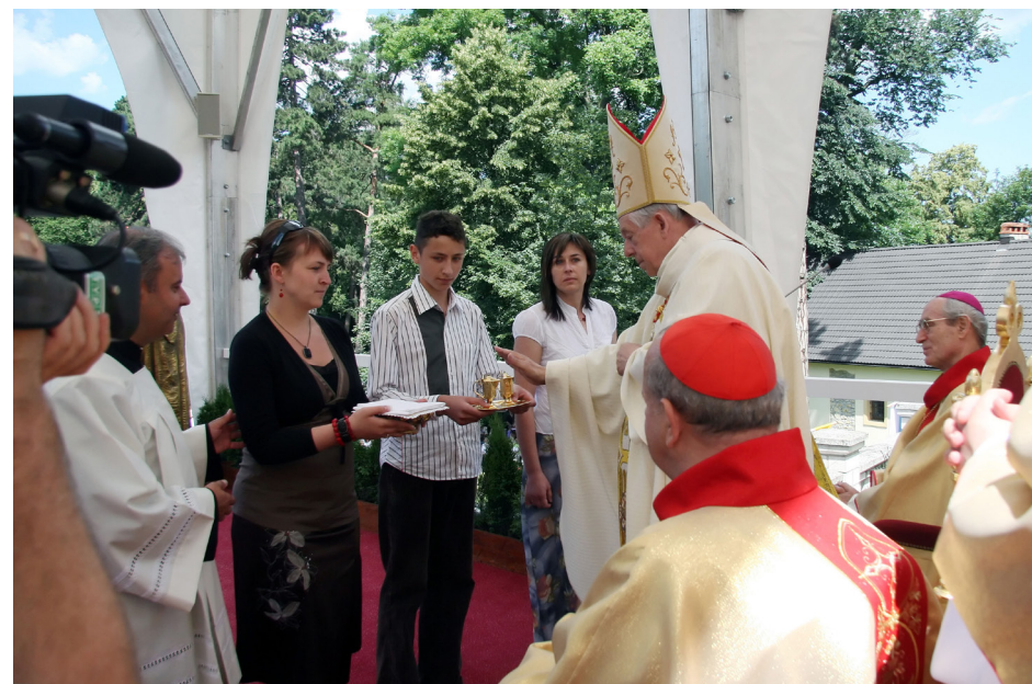
Msza św. podczas 340. Zebrania Plenarnego Konferencji Episkopatu Polski

W dniach od 15 do 17 czerwca 2007 r. w Kamieniu Śląskim zgromadzili się biskupi polscy na 340. zebraniu plenarnym Konferencji Episkopatu Polski. Miejsce spotkania było nieprzypadkowe, gdyż w tym roku obchodzono 750. rocznicę śmierci św. Jacka Odrowąża. O obecności i wstawiennictwie świętych pochodzących z ziemi opolskiej przypominała także 30 września 2007 r. wielka uroczystość beatyfikacji Marii Luizy Merkert, śląskiej