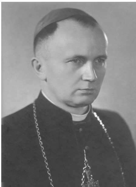
bp Wacław Wycisk

szpitala. Potrzeby przyszłej diecezji wymagały jednak tego, aby ks. Wycisk zdobył wykształcenie z zakresu prawa kanonicznego, dlatego został skierowany na studia na Katolickim Uniwersytecie Lubelskim. Tak przygotowany, ks. Wycisk podjął obowiązki oficjała Sądu Biskupiego. Obowiązki te pełnił aż do momentu sakry biskupiej. Biskup Wycisk, choć formalnie ustanowiony biskupem pomocniczym gnieźnieńskim, faktycznie posługę swoją pełnił na terenie Śląska Opolskiego.