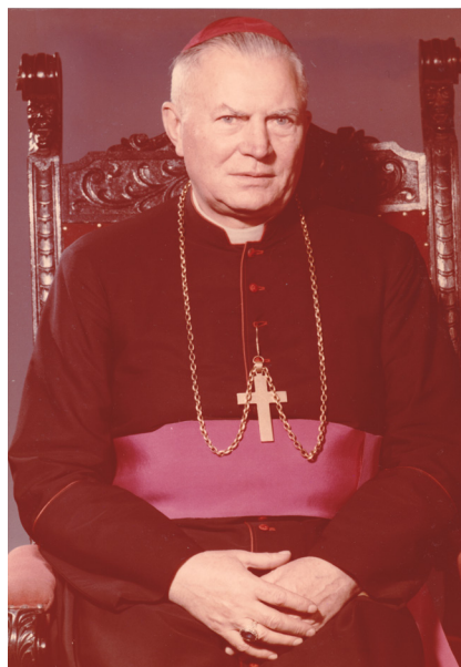
bp Antoni Adamiuk

Tak ukształtowane struktury i życie duchowe, które rozwijały się na ziemiach Śląska Opolskiego, doprowadziły do przełomowej decyzji Stolicy Apostolskiej. 28 czerwca 1972 r. papież Paweł VI ogłosił bullę, w której jednym z postanowień było utworzenie diecezji opolskiej i włączenie jej do metropolii wrocławskiej.