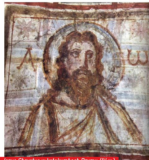
Jezus Chrystus w katakumbach Rzymu, (IV w.)

Przeżywaną dzisiaj Uroczystość Chrystusa Króla liturgia Kościoła wiąże m.in. z tekstem pochodzącym z Apokalipsy św. Jana Apostoła, który jest jak gdyby wielkim skrótem chrystologii chrześcijańskiej i zawiera kilka niezwykle ważnych tytułów dotyczących władzy Chrystusa: „Amen. Jam jest Alfa i Omega, mówi Pan Bóg, który jest, który był i który przychodzi, Wszechmogący”. Chrystus jest Bożym „tak” – wypełnieniem Jego woli aż do końca, wiecznym „Amen” modlitwy stworzenia, z którym złączył się przez Wcielenie. Dlatego też można powiedzieć o Nim, że jest „wiernym świadkiem” Boga, którego zna najlepiej i w sposób jedyny wśród istot ziem-