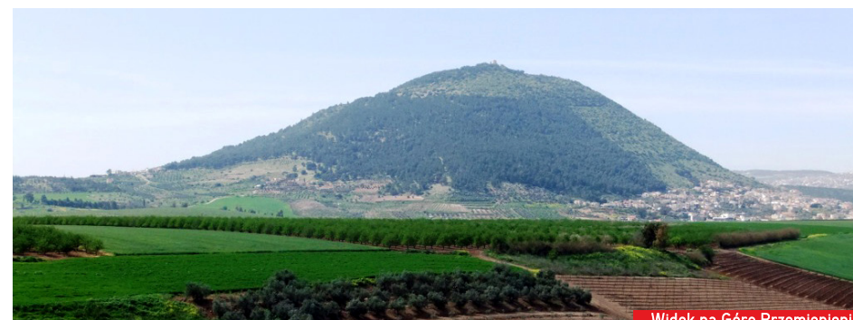
Widok na Górę Przemienienia

wyrasta z doliny Ezdrelon, na skraju Ga- lilei, i samotnie wznosi się on na prawie sześćset metrów nad poziomem morza. Majestatyczny wygląd góry natchnął Psal- mistę, który stawiał ją na równi z wyso- kim szczytem Hermonu, wzywając obie góry, by dały świadectwo chwały Bożej: „Tabor i Hermon wykrzykują radośnie na cześć Twego imienia” (Ps 89,13). Ta święta góra północnych pokoleń Izraela, dla któ- rych stanowiła punkt graniczny (Joz 19,22), związana jest ze sławnym zwycięstwem, odniesione tu przez Baraka, wspiera- nego radą Debory, nad wojskami Sisery (Sdz 4,6.12-16). Później stanowiła ośro- dek kultu bałwochwalczego, ganionego przez proroka Ozeasza (5,1). Antioch III, król Syrii, w 218 r. przed Chr., a Wespazjan w roku 67 po Chr. zajęli ten niełatwy do zdobycia punkt strategiczny, podstępem