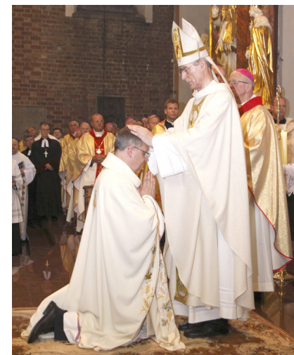
Święcenia biskupie z 2009 r.